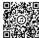
▲酒游館周辺 Google マップ