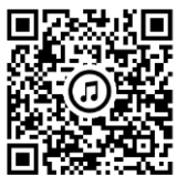
YUGEYA 周辺▶ Google マップ

B I W A K O ビエンナーレ同エリア同時開催中 公式サイト https://energyfield.org/biwakobiennale/ »